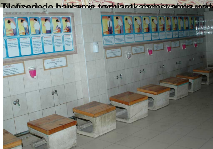
İslam Vakfı ve Merkez Site Camii, 2000m 2 alanında, Samsun'da inşa edilmiştir. 2000 yılında tamamlanmıştır.